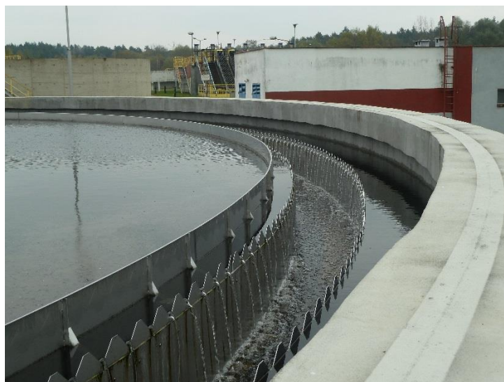
Zdjęcie 10 „Koryto przelewowe na Oczyszczalni Ścieków w Jaworznie”.