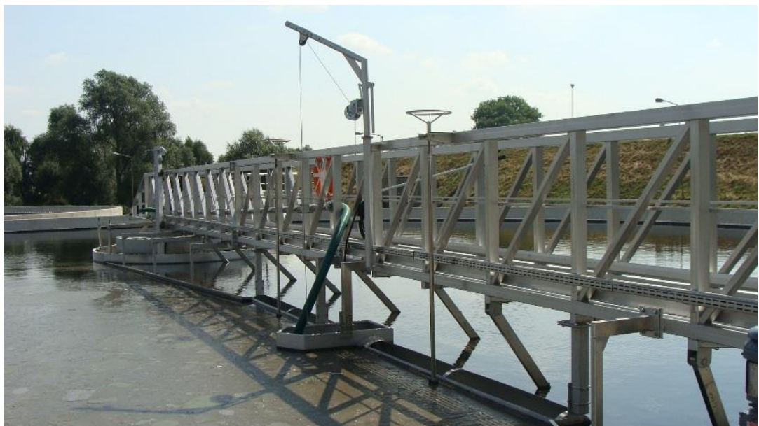
Zdjęcie 2 „Zgarniacz na Oczyszczalni Ścieków w Stargardzie Szczecińskim”.