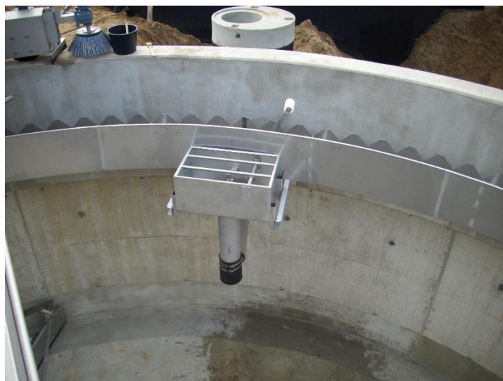
Zdjęcie 5 „Komora zanurzeniowa cz. pływ. na Oczyszczalni Ścieków w Tomaszowie Mazowieckim”.

Drugim wariantem jest zanurzeniowa komora odpływu części pływających umieszczona przed odbojnicą. Komora zanurzona jest pod ściekami na głębokość h \sim 40 [mm].