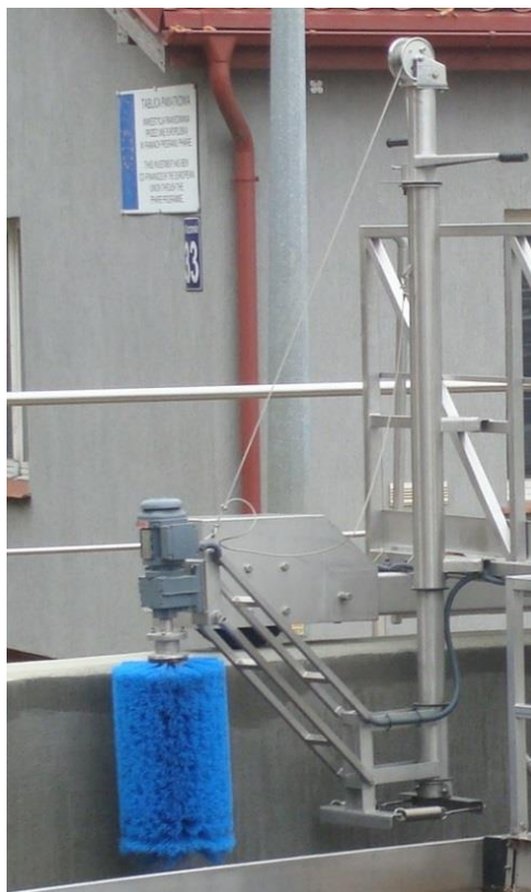
Zdjęcie 8 „Szczotka koryta przelewowego na Oczyszczalni Ścieków w Kotbaskowie”.

Zgarniacz radialny może zostać wyposażony w szczotkę koryta zamontowaną do pomostu, która służy do mycia dna i ścian koryta z przelewami pilastymi. Częstotliwość mycia uzależniona jest od szybkości zarastania koryta glonami, czyli od specyficznych warunków panujących na danej oczyszczalni. Gabaryty szczotki uzależnione są od wielkości koryta przelewowego.