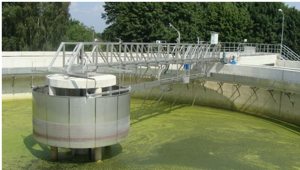
Zdjęcie 3 „Zgarniacz na Oczyszczalni Ścieków w Nowym Tomysłu”.

Koryto uchylnie regulowane ręcznie lub elektrycznie- wymiary koryta: D=250 [mm].