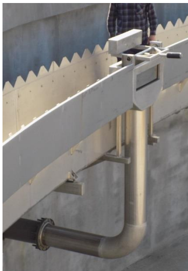
Zdjęcie 4 „Komora boczna cz. pływ. na Oczyszczalni Ścieków w Jaworznie”.

Pierwszym jest komora odpływu części pływających umieszczona pomiędzy korytem a odbojnicą. W ścianie czołowej komory umieszczony jest otwór prostokątny, przez który napływają części pływające. Otwór zamknięty jest pokrywą zawieszoną na ramieniu obrotowym.