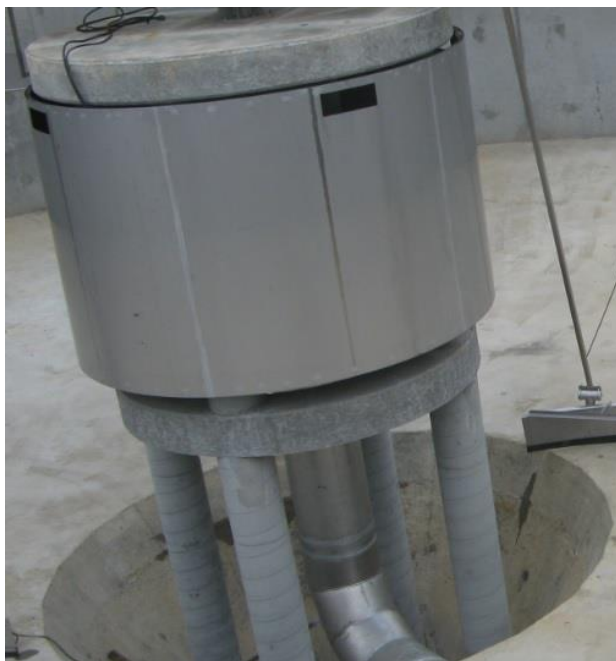
Zdjęcie 7 „Deflektor centralny z oknami wypływowymi na Oczyszczalni Ścieków w Rypinie”.