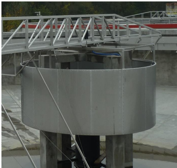
Zdjęcie 6 „Deflektor centralny podwieszony do pomostu na Oczyszczalni Ścieków w Jaworznie”.

Deflektor centralny służy do tłumienia napływu ścieków doprowadzanych poprzez układ dopływowo. Montowany jest do kolumny centralnej na osadniku lub podwieszany do pomostu. Gabaryty określa Zamawiający.