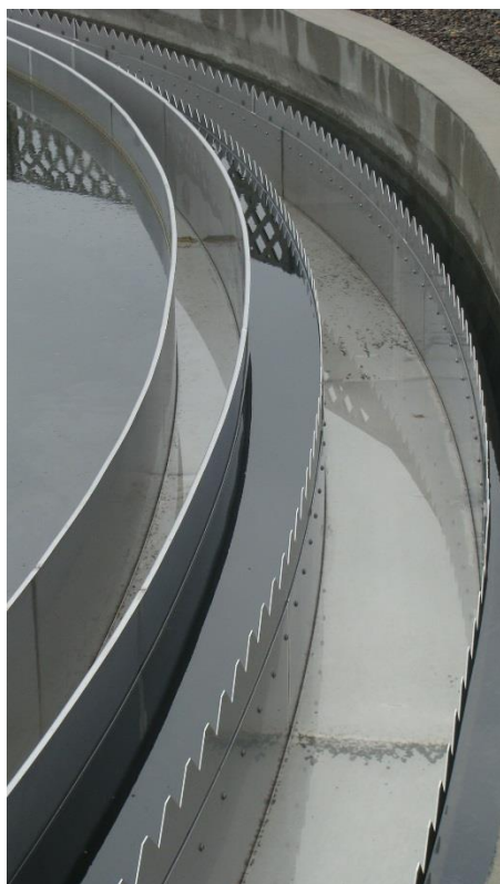
Zdjęcie 9 „Koryto przelewowe na Oczyszczalni Ścieków w Kluczach”.