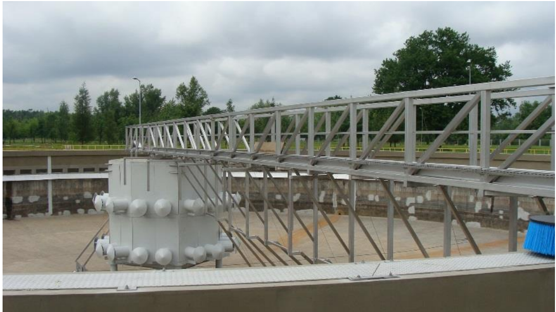
Zdjęcie 1 „Zgarniacz na Oczyszczalni Ścieków Kujawy w Krakowie”.

Pomost zgarniacza jest elementem samonośnym. Konstrukcja pomostu wykonana jest jako kratownica. Obciążenie barierki zgodnie z normą PN-EN ISO 14122-3 :2005. Konstrukcja pomostu wykonana ze stali kwasoodpornej: gat. 0H18N9 wg PN-EN 10088-1.