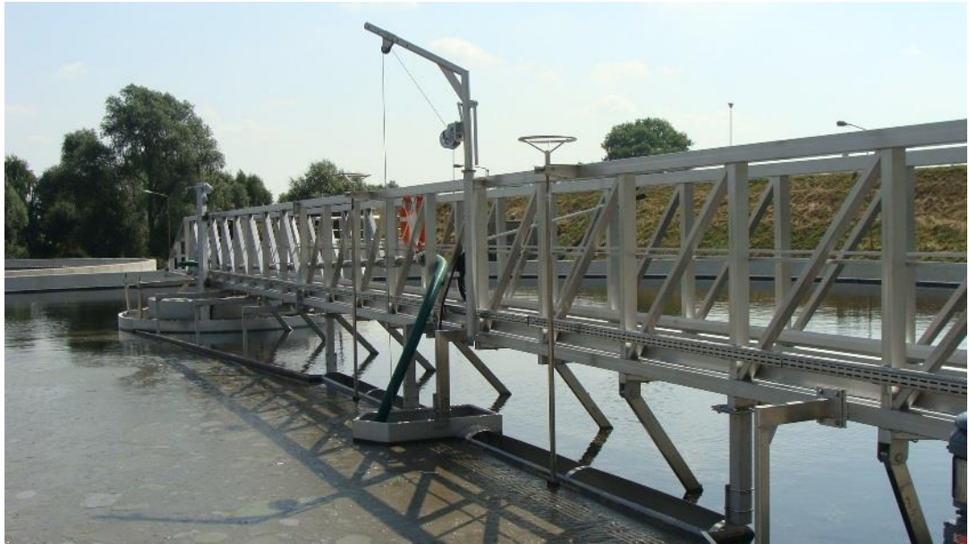
Zdjęcie 2 „Zgarniacz na Oczyszczalni Ścieków w Stargardzie Szczecińskim”.